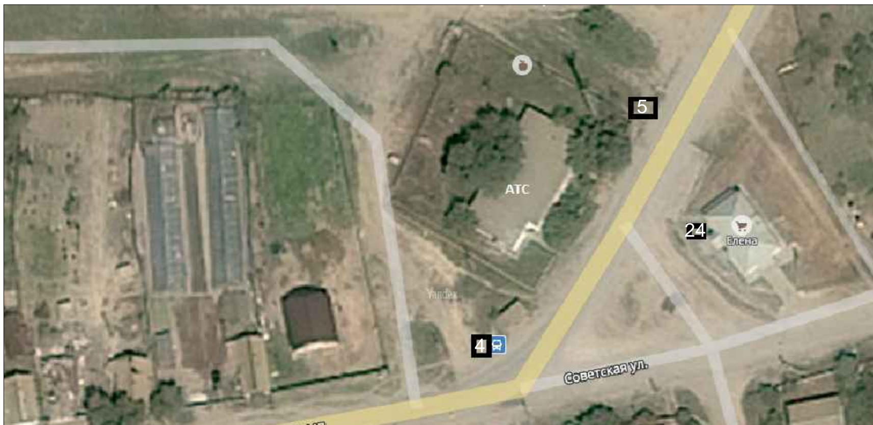
Схема расположения нестационарных торговых объектов с. Заплавное Заплавненского сельского поселения Ленинского муниципального района в М 1: 1000