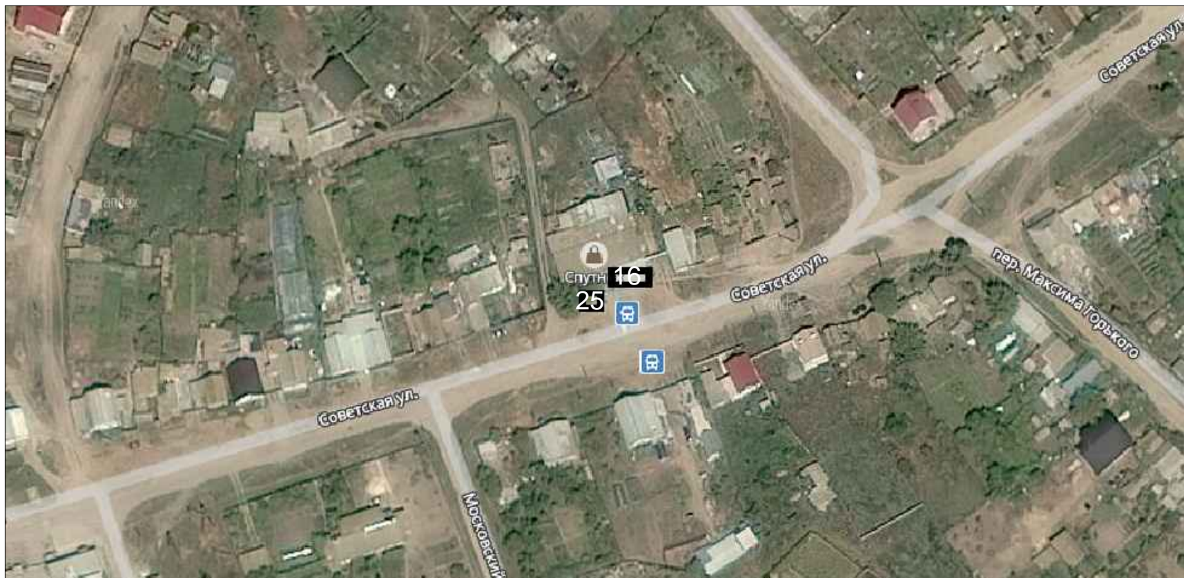
Схема расположения нестационарных торговых объектов с. Заплавное Заплавненского сельского поселения Ленинского муниципального района в М 1: 1000