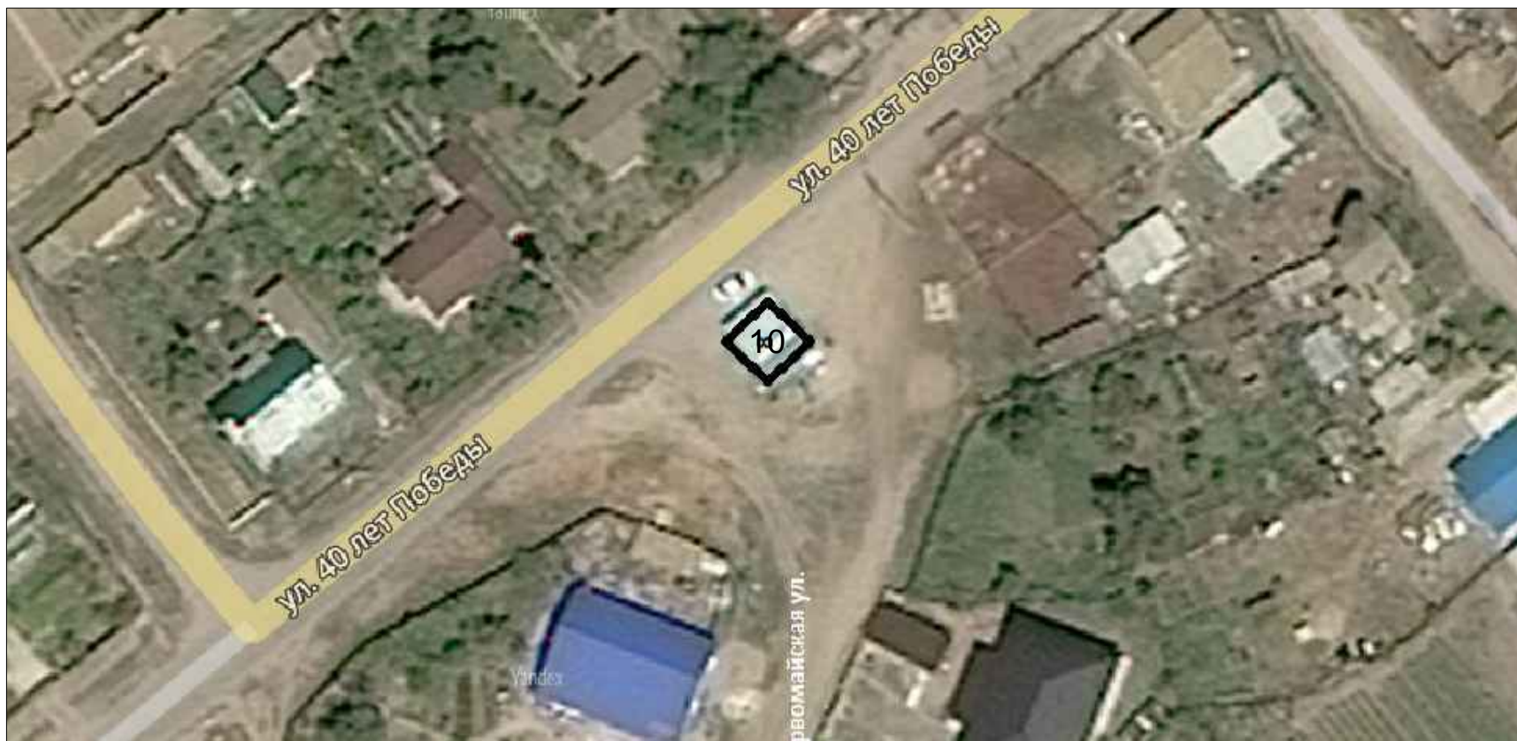
Схема расположения нестационарных торговых объектов с. Заплавное Заплавненского сельского поселения Ленинского муниципального района в М 1: 1000