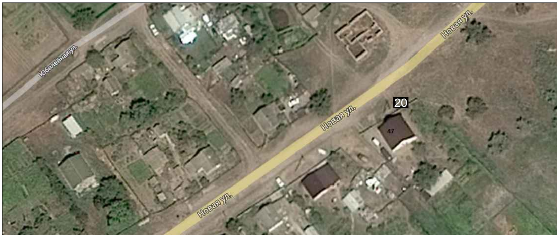
Схема расположения нестационарных торговых объектов п. 8-е Марта Заплавненского сельского поселения Ленинского муниципального района в М 1: 1000