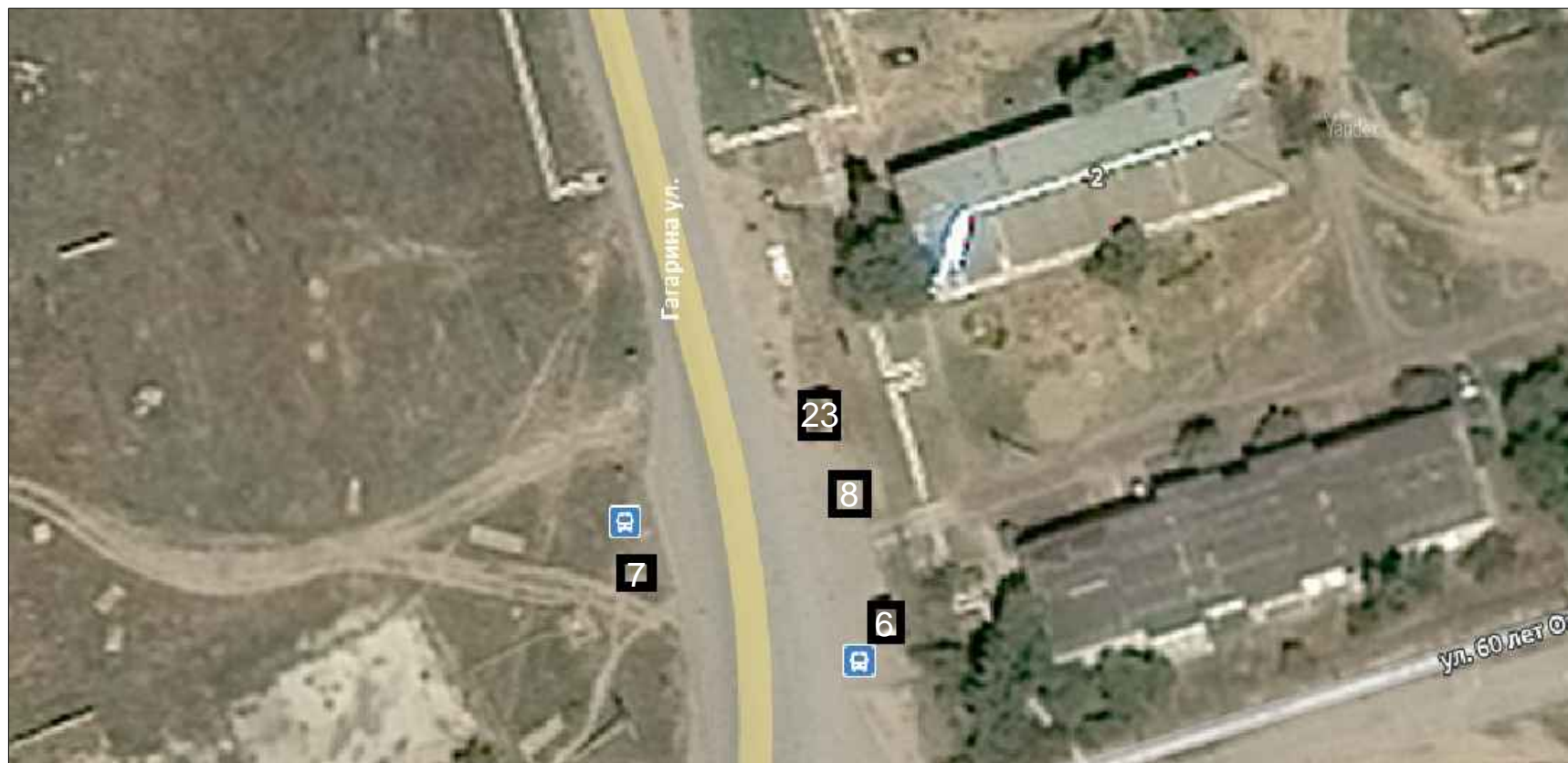
Схема расположения нестационарных торговых объектов с. Заплавное Заплавненского сельского поселения Ленинского муниципального района в М 1: 1000